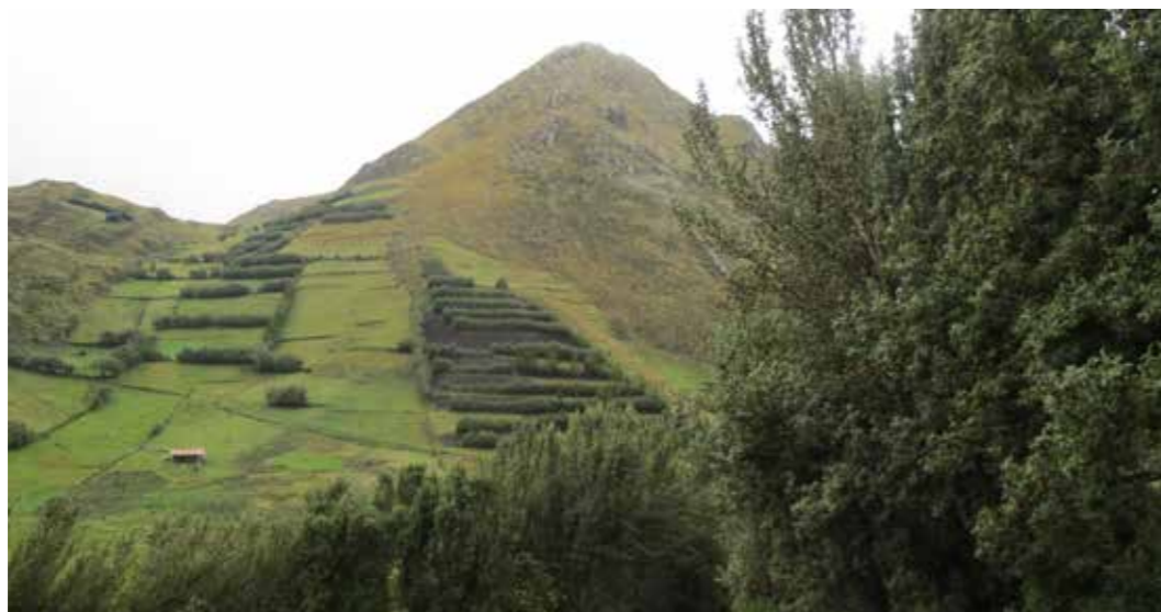
Foto 12: Cercas vivas. Alimarca (Perú)