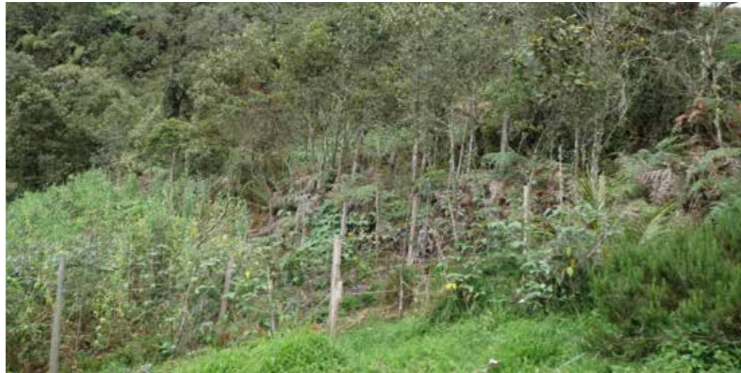
Foto: Protección de vegetación natural. Choachí. Colombia