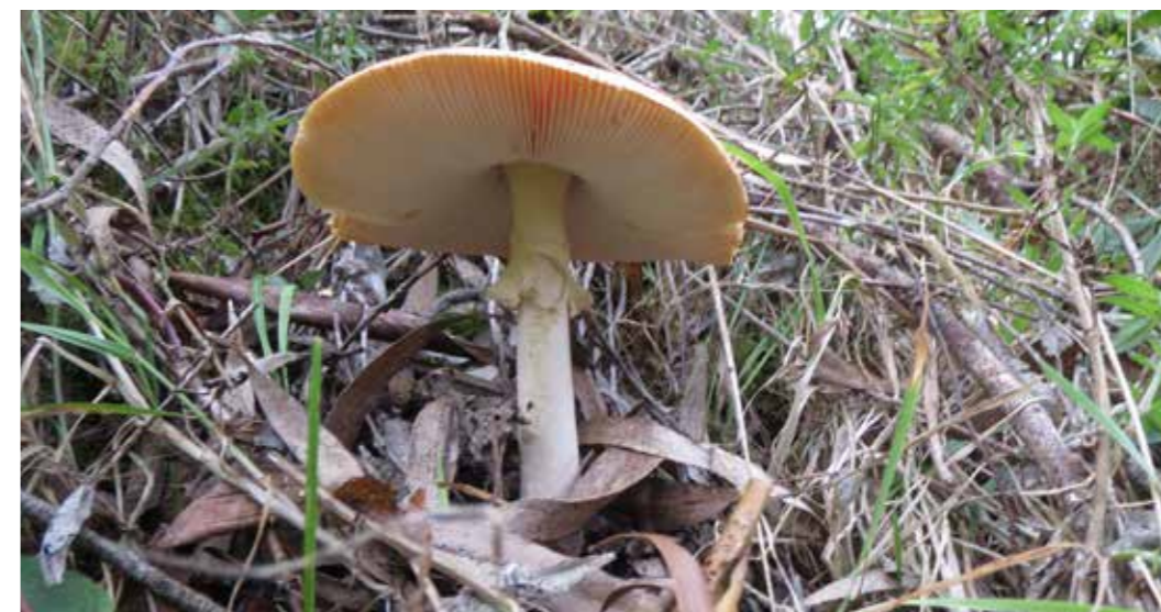
Foto 25: Cultivo de hongos. Choachí (Colombia)