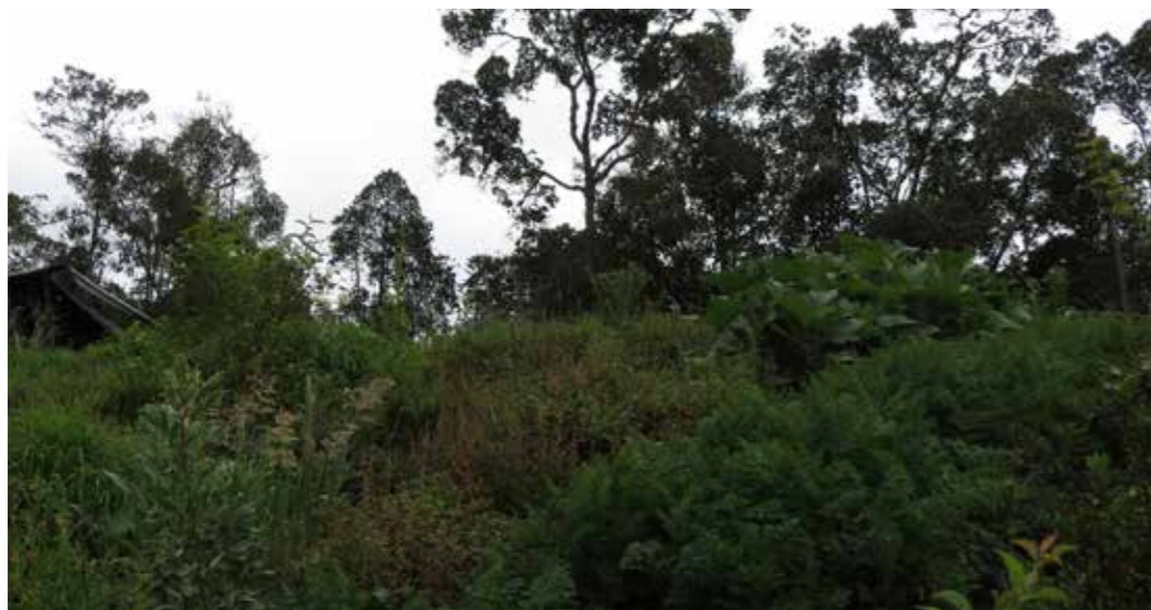
Foto 15: Parcela ecológica. Choachí (Colombia)