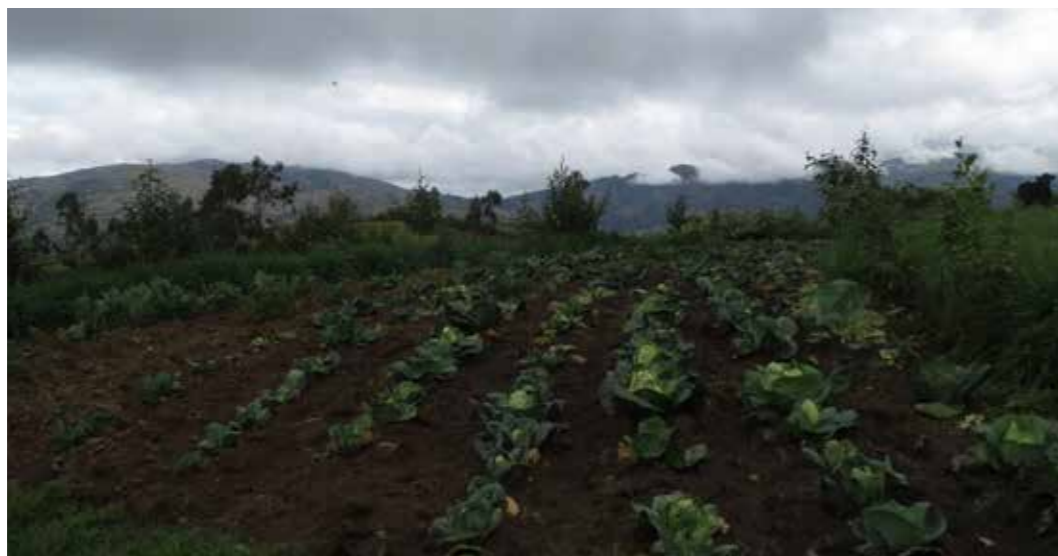
Foto 18: Rotación de cultivos. San Marcos (Perú)