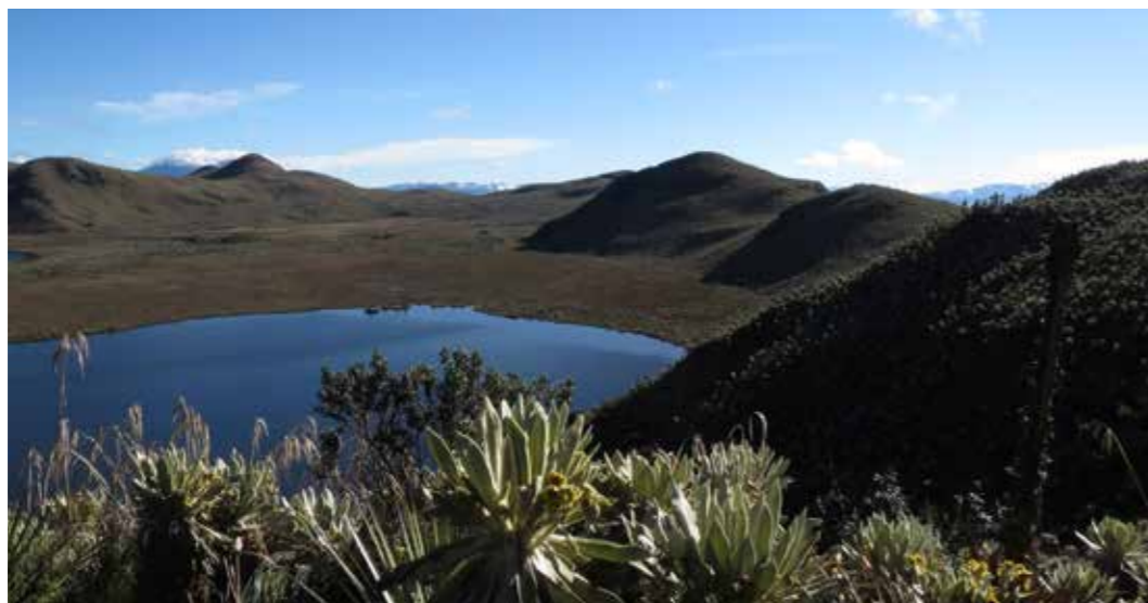
Foto 6: Areas de conservación. Reserva Ecológica El Angel. Carchi (Ecuador)