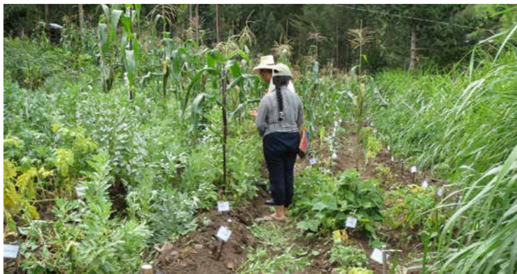
Foto 17: Rotación de cultivos. Ñangali (Colombia)