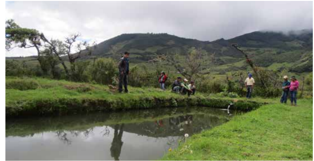
Foto 27: Piscicultura. San Juan (Perú)

La práctica es realizada por mujeres en la mayoría de los casos, el hombre se encarga de la comercialización del producto.