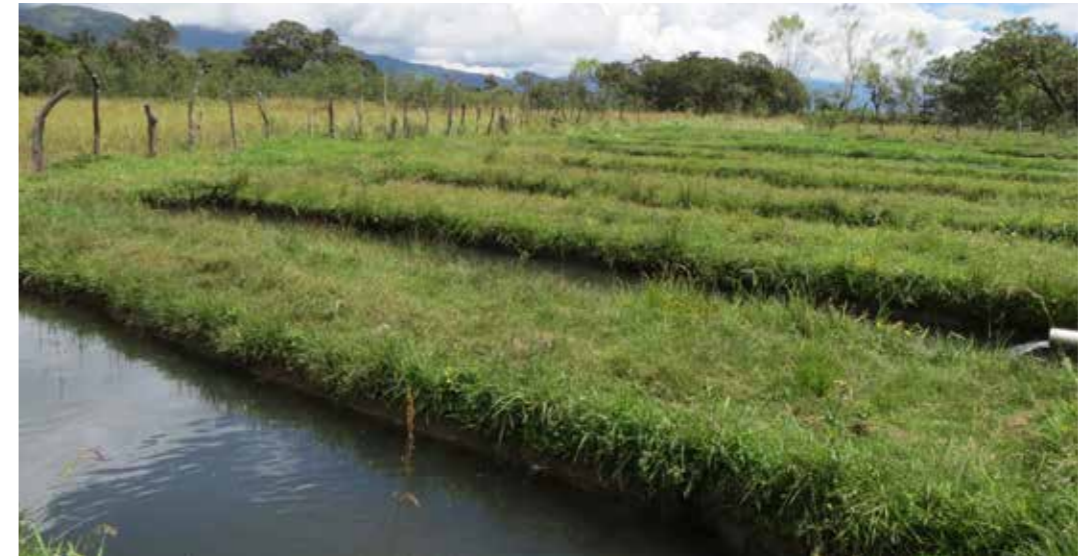
Foto 30: Alevines producción piscícola. San Juan (Perú)