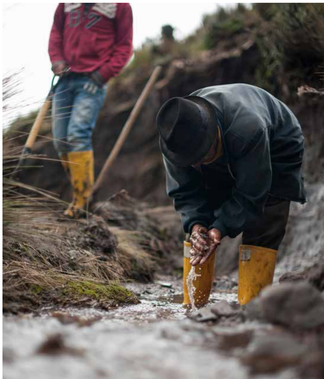
Foto 33: Cosecha de agua. Cuatro Esquinas, Chimborazo (Ecuador) Autor: Colectivo Sinestesia