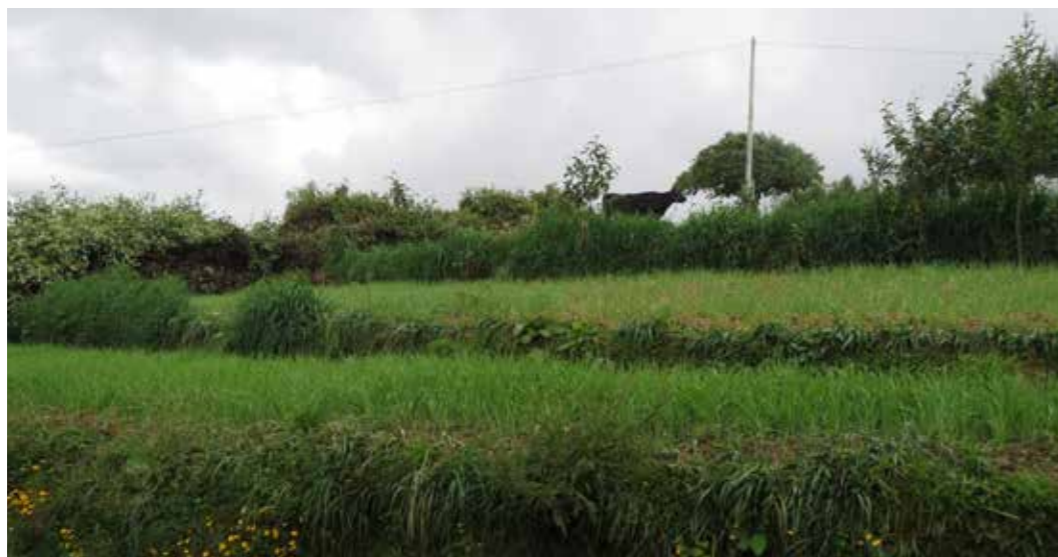
Foto 13: Terrazas para cultivos. Alimarca (Perú)