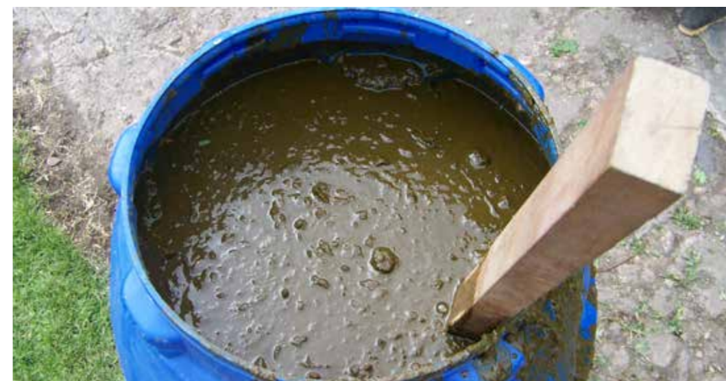
Foto 20: Fertilizante natural. Papallacta (Ecuador)