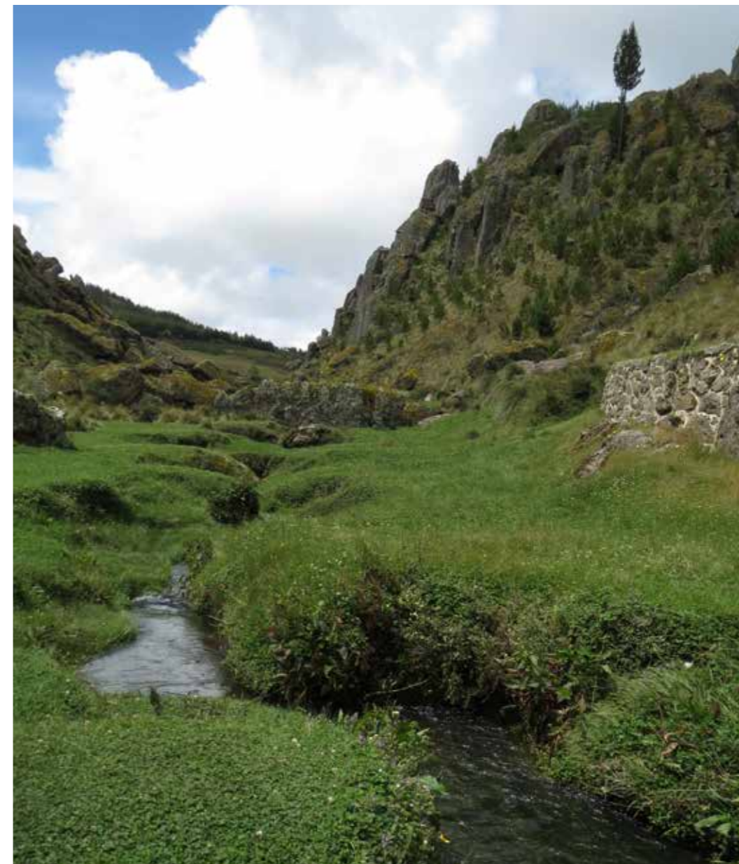
Foto 32: Cosecha de agua. Cumbemayo (Perú) Autora: María Augusta Almeida

La práctica es realizada por hombres y mujeres en la mayoría de los casos.