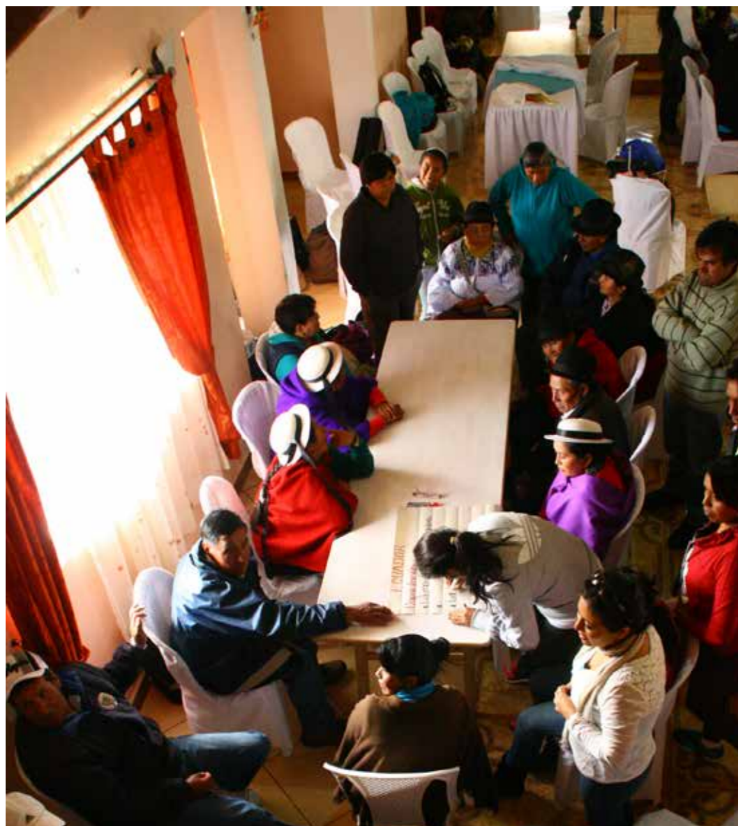
Foto 35: II Encuentro de Comunidades de los Páramos de Colombia Ecuador y Perú. El Ángel, Carchi (Ecuador)