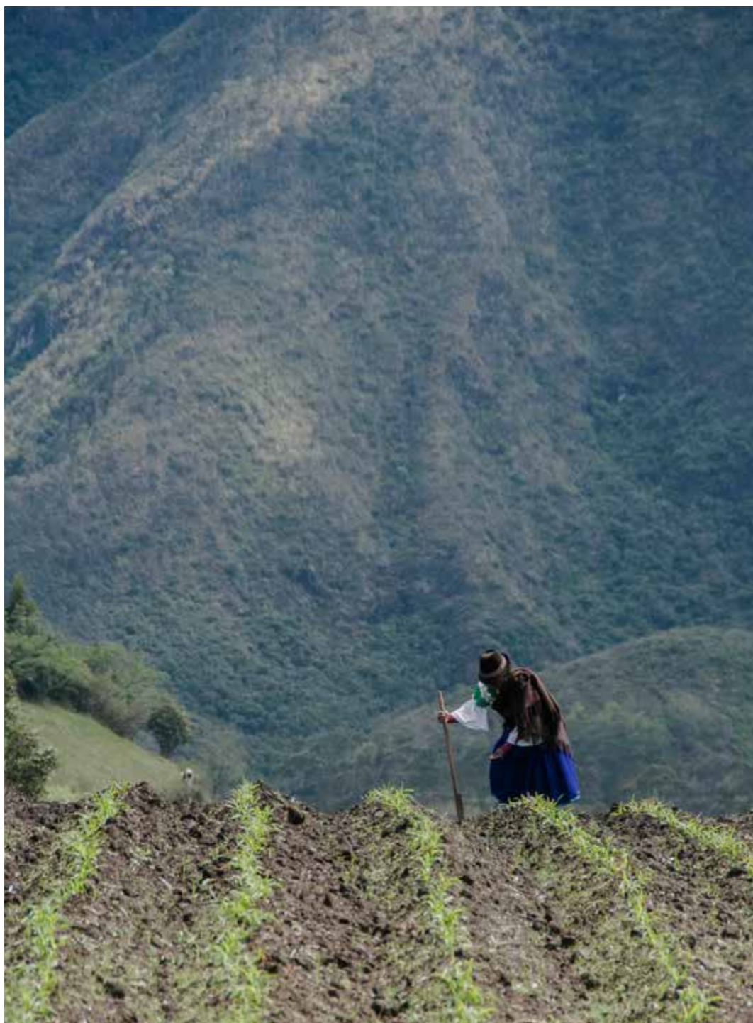
@MARCOS CERRA, ECUADOR

La designación de entidades geográficas y la presentación del material en este libro no implican la expresión de ninguna opinión por parte del Ministerio de Asuntos Exteriores de Finlandia, la UICN, Tropenbos Internacional Colombia, el Instituto de Investigación de Recursos Biológicos Alexander Von Humboldt, la Corporación Ecopar, la Corporación Grupo Randi Randi, el Instituto de Montaña o de otra organización participante respecto a la condición jurídica de ningún país, territorio o área, así como de sus autoridades, o en lo referente a la delimitación de sus fronteras y límites.