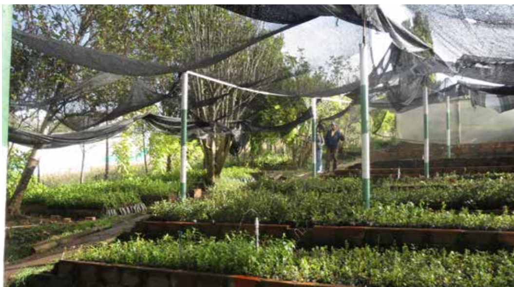
Foto 7. Vivero comunal. Tutaza (Colombia)