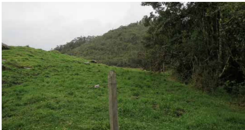
Foto 4: Protección de la vegetación natural. Guatavita (Colombia)