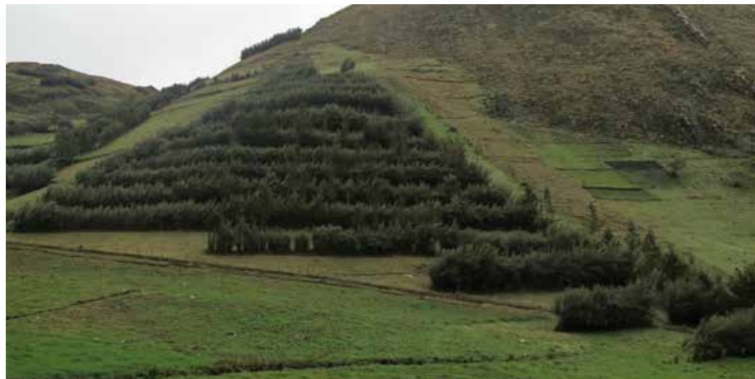
Foto 2: Recuperación de suelos. Alimarca (Perú)