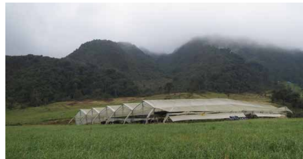
Foto 21: Zonificación Ganadera. Guatavita (Colombia)

La práctica es realizada por hombres y mujeres en la mayoría de los casos.