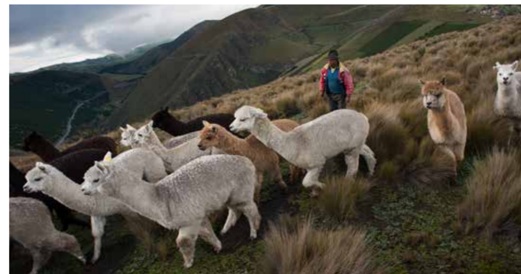
Foto 23: Alpacas. San Juan, Chimborazo (Ecuador)

La práctica es realizada por mujeres en la mayoría de los casos, el hombre se encarga de la comercialización del producto.