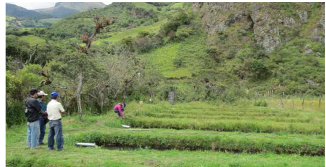
Foto 28: Piscicultura. San Juan (Perú)