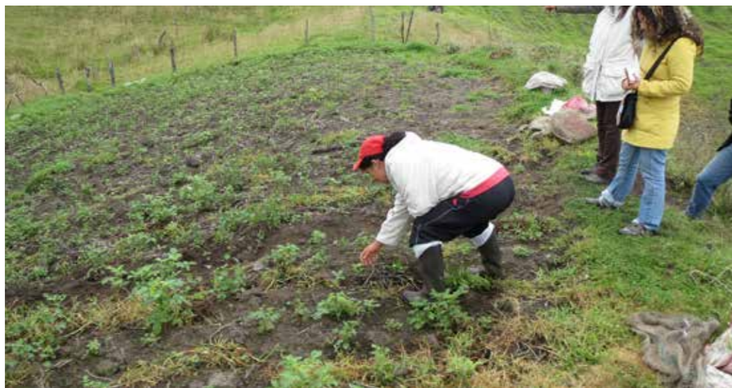
Foto 3: Recuperación de suelos. Choachi (Colombia)