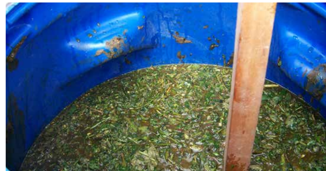
Foto 19: Fertilizante natural. Papallacta (Ecuador)

La práctica es realizada por mujeres y hombres de forma similar.