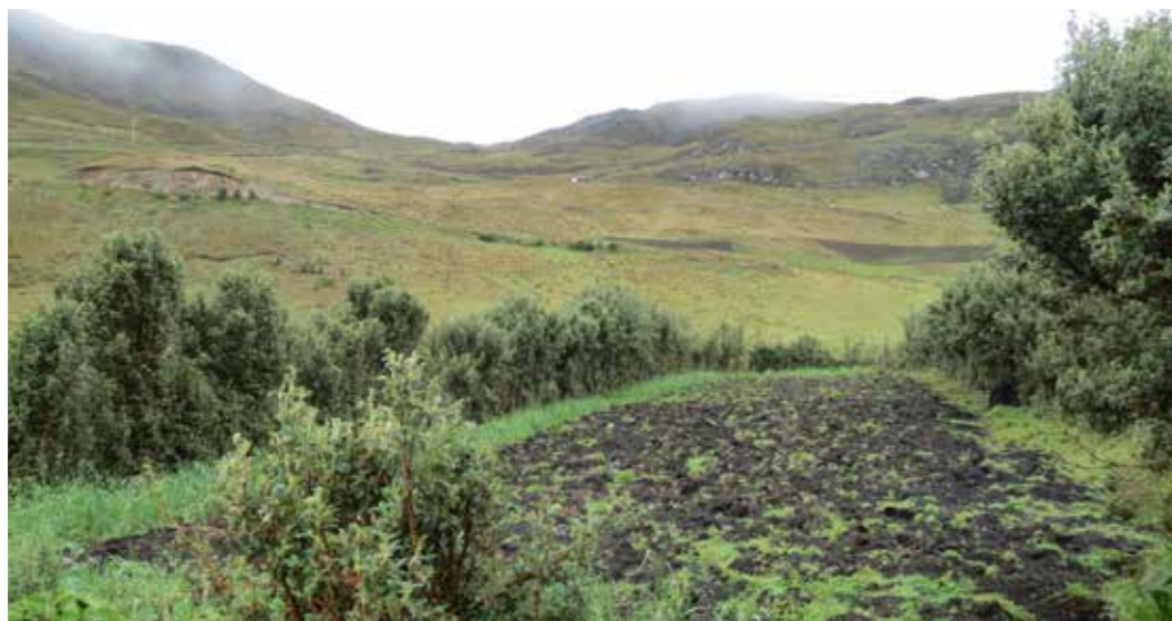
Foto 11: Cercas vivas. Alimarca (Perú)