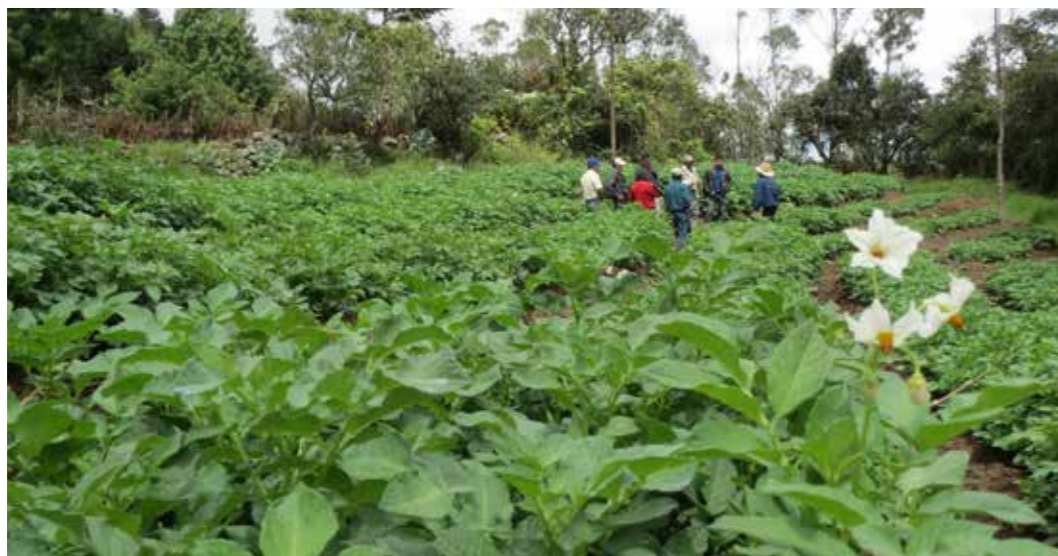
Foto 16: Parcela ecológica. Totoras, Piura (Perú) Autora: María Augusta Almeida