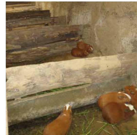
Foto 31: Crianza de cuyes. San Marcos (Perú)