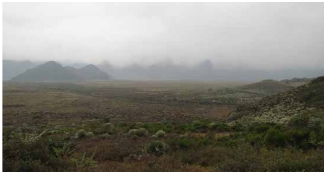
Foto 9: Páramos, humedales de alta montaña. Martos (Colombia)