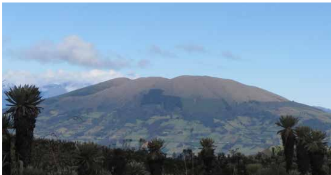
Foto 5: Areas de conservación. Comuna ancestral de indígenas pastos de La Libertad, provincia de Carchi (Ecuador) Autora: María Augusta Almeida