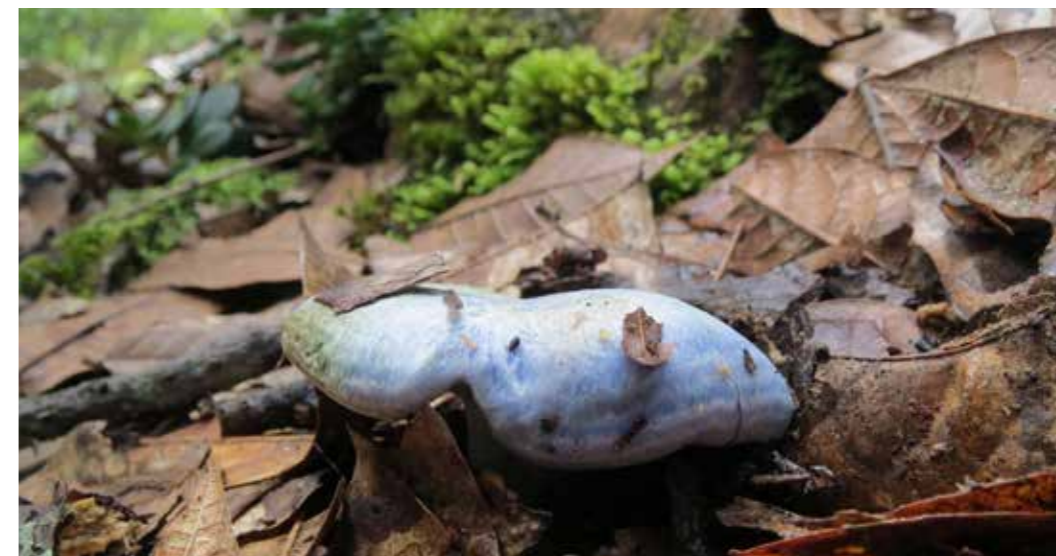
Foto 26: Cultivo de hongos. Villa de Leyva (Colombia) Autora: María Augusta Almeida