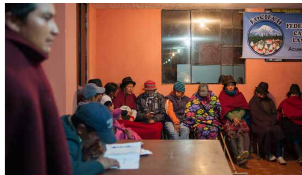
Foto 34: Proceso de planificación comunitario. Cuatro Esquinas, Chimborazo (Ecuador) Autor: Colectivo Sinestesia

La práctica es realizada por hombres y mujeres en la mayoría de los casos.