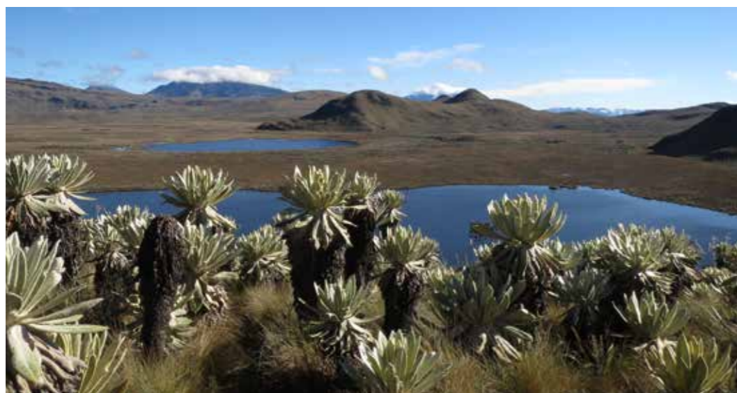
Foto 10: Páramos, humedales de alta montaña. Laguna del Voladero, Reserva Ecológica El Ángel. Carchi (Ecuador)