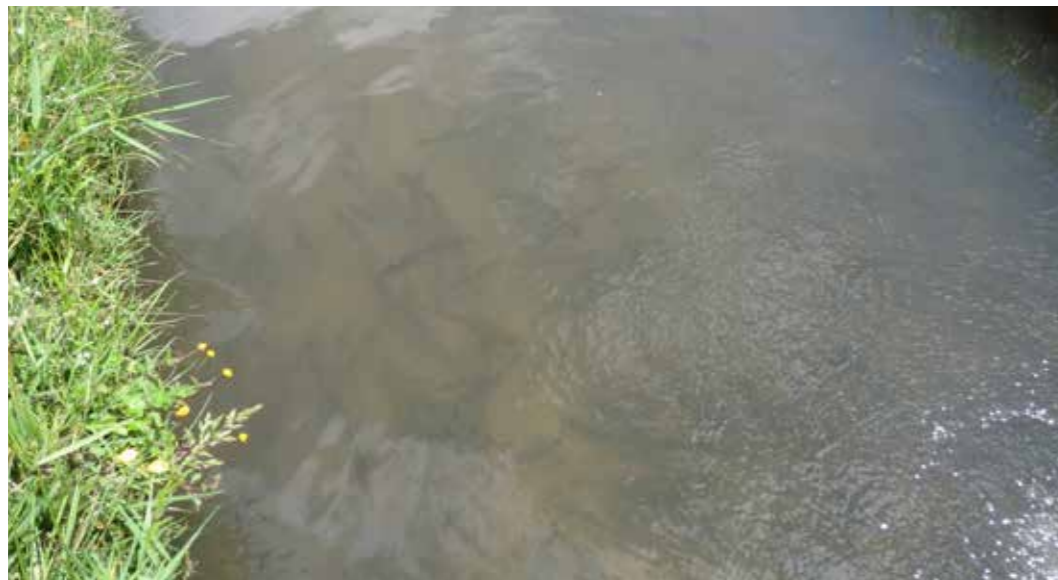
Foto 29: Alevines producción piscícola. San Juan (Perú)

La práctica es realizada por mujeres en la mayoría de los casos, el hombre se encarga de la comercialización del producto.