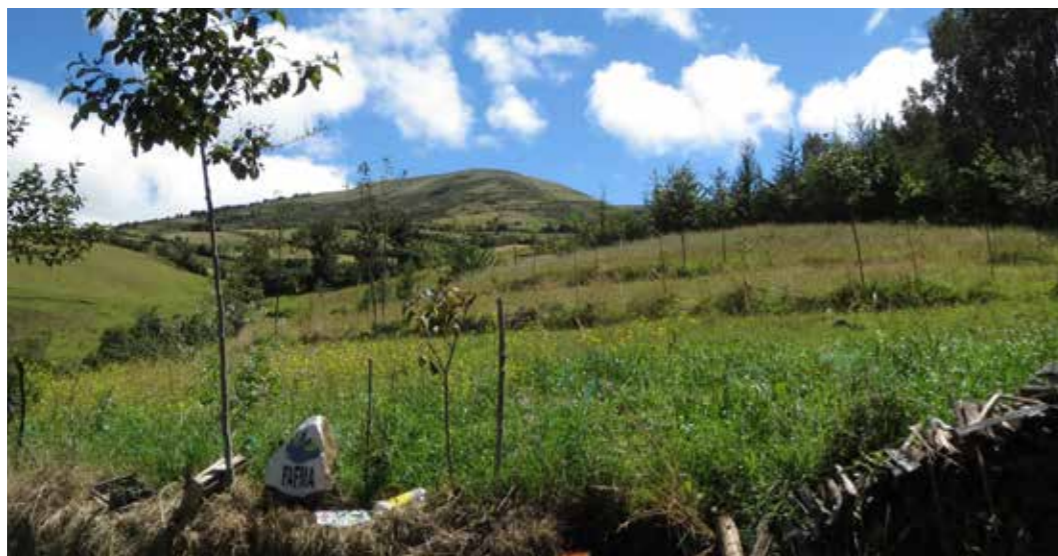
Foto 14: Terrazas para cultivos. Chalgvar (Ecuador)