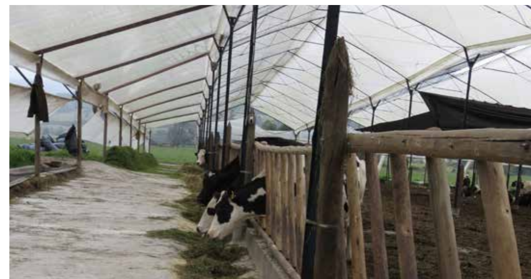
Foto 22: Zonificación Ganadera. Guatavita (Colombia) Autora: María Augusta Almeida