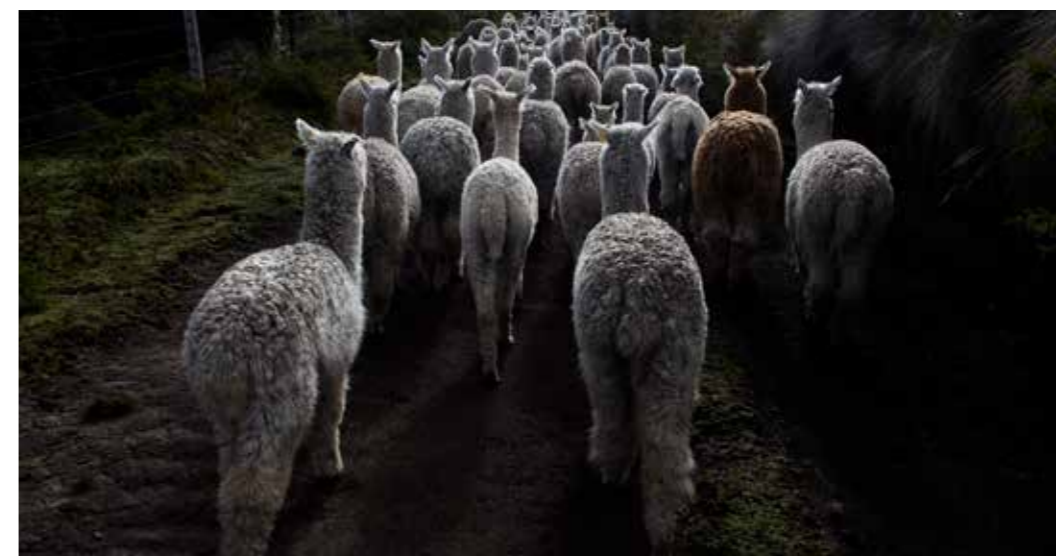
Foto 24: Alpacas. Zuleta, Imbabura (Ecuador) Autor: Colectivo Sinestesia