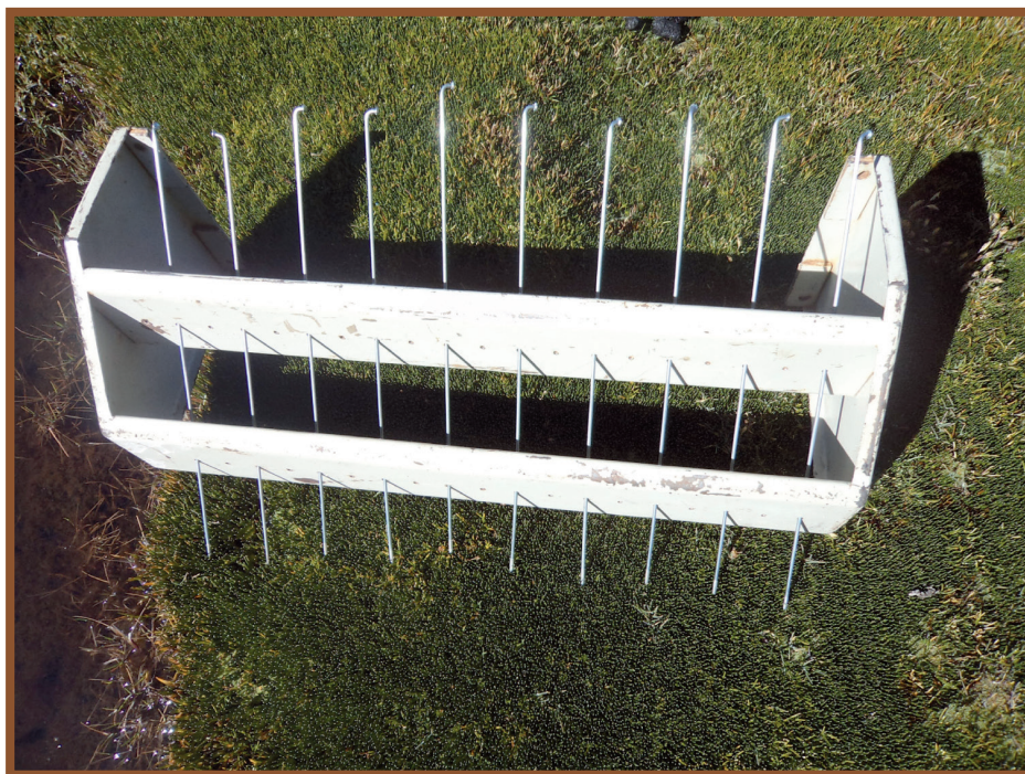
Figura 2. Muestreador de rejilla de Goodall (1952), el cual permite estimar la composición florística y la cobertura vegetal relativa de los bofedales a través de métodos de puntos de contacto.

de conservación de los bofedales de la Reserva Nacional de Fauna Eduardo Avaroa (REA) y Zonas de Amortiguación (ZA) (Alzérreca et al. 2001a, b, Prieto & Barrera 2010). Similares criterios fueron utilizados en otros estudios semejantes (Copa et al. 2003, Yujra 2007, Siguyro 2008).