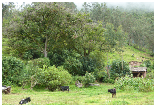
En primer plano: árboles nativos integrados en un sistema silvopastoril; en segundo plano: plantaciones con eucalipto para el uso de la madera y leña.

La documentación y el análisis de los conocimientos locales sobre agroforestería son de gran utilidad, en particular dada la falta de estudios científicos sobre el tema. Para complementar estos conocimientos locales existentes, se recomienda la realización de estudios científicos especializados (p.ej. en el caso presentado, para identificar plantas leñosas que puedan ser usadas para proteger los cultivos contra los eventos climáticos extremos). De esta manera, la combinación de estos dos tipos de conocimientos permitirá la identificación de soluciones innovadoras a los nuevos retos que enfrentan los pequeños agricultores debido al cambio climático.