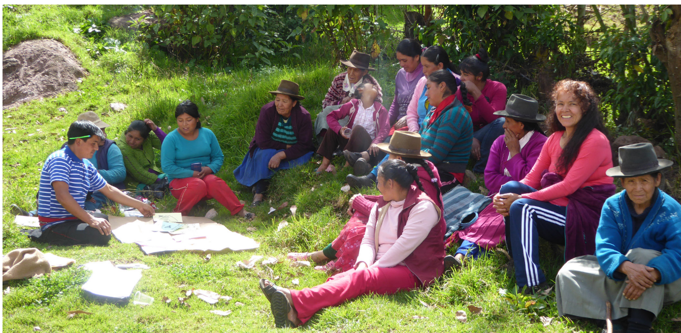
Grupos focales y ejercicios de priorización con mujeres para documentar sus conocimientos y preferencias sobre los árboles y los arbustos de sus comunidades.

El manejo de árboles y arbustos en los paisajes agrícolas tiene un gran potencial para la adaptación de los pequeños agricultores andinos al cambio climático. Actualmente existe una gran diversidad de prácticas y especies agroforestales. También hay una gran riqueza de conocimientos locales sobre las funciones agroecológicas de estos árboles. Sin embargo, en el marco de la planificación de medidas adaptativas, la investigación científica es necesaria para analizar la idoneidad de las prácticas agroforestales en contextos socio-ecológicos determinados. El diseño de estas acciones debe hacerse de forma participativa e inclusiva, considerando aspectos de género y las preferencias de los pequeños agricultores.